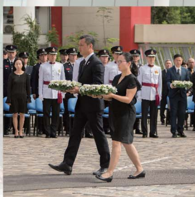
不同單位的代表先後獻上花圈。