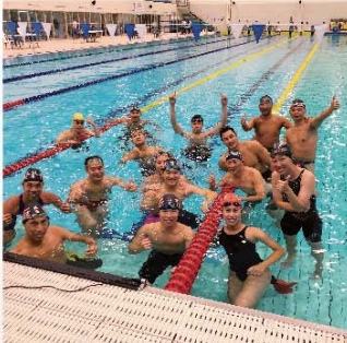
除了室內游泳比賽，游泳隊還參加了拯溺和公開水域等賽事，合共奪得125金、51銀和22銅的驕人成績。

第13屆世界消防競技大賽9月在韓國忠州舉行。本處派出的118人代表團上下一心，勇奪248金、115銀和82銅，合共445面獎牌，榮登大賽獎牌榜總冠軍，成績斐然。