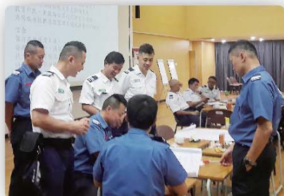
消防及救護隊員在「知識茶座」中進行分組討論。

知識管理小組10月在消防及救護學院舉辦「知識茶座」，探討科技與消防及救護的關係，有五十多位消防及救護隊員參加。在短短兩個多小時的茶座中，前線同事在輕鬆的氣氛下打成一片，暢所欲言，並就消防及救護知識作出深入的交流，集思廣益。最後，七個小組的主持向眾人作總結及分享討論成果。