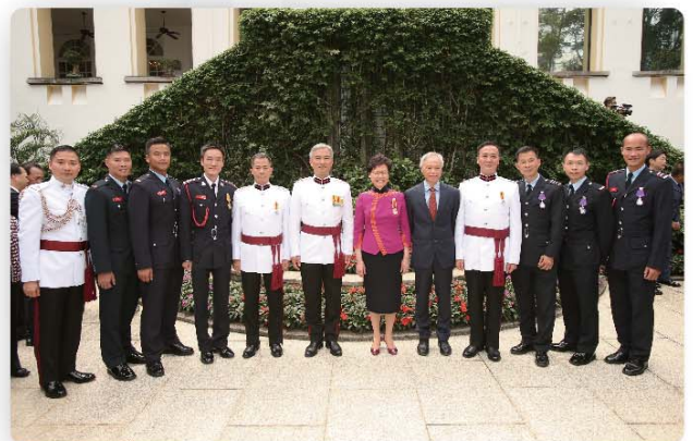
行政長官林鄭月娥(右六)和處長李建日(右七)與獲授勳銜及嘉獎的屬員合照。

服務消防處逾35年的消防總長江炳林和服務本處逾34年的退休副消防總長魏德勇則獲頒香港消防事務卓越獎章。另外，亦有多名表現出色的屬員獲頒香港消防事務榮譽獎章(8人)及行政長官公共服務獎狀(10人)。