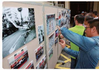
旺角消防局人員特別搜羅舊照片，讓一眾嘉賓緬懷昔日的人和事。

九龍總區消防總長羅紹衡博士及副消防總長丘志安，於10月13日出席旺角消防局成立65周年慶祝會，並主持對聯揭幕和切金豬酬神儀式。包括退休長官及駐局前輩在內的一眾賓客，濟濟一堂敘舊交誼，細看舊日照片，緬懷昔人和事，訴說工作苦與樂，氣氛熱鬧溫馨。