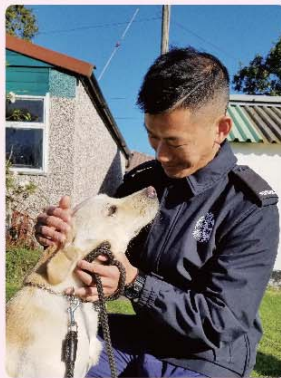
火警調查犬性格好奇活潑和善良，首次與領犬員見面已相處得十分融洽。

訓練課程十分多元化，包括犬隻的服從訓練、於模擬火場尋找助燃劑的操練、以及學習狗隻的心理與身體結構。參加者經過三星期的實習操練和講堂理論後，均開始掌握領犬技術，亦更認識牠們的性格和建立默契。課程的最後一周，參加者均順利通過訓練學校的考核和畢業。除了一起協助火警調查，他們還希望跟火警調查犬出席公眾宣傳防火活動接觸市民，進一步提升消防處專業和正面形象。