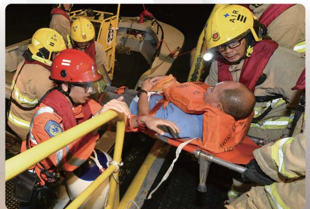
救援人員模擬將傷者移至安全地方。

我駐守機場消防隊約六年，在是次演習中負責駕駛快艇進行救援。當收到召喚後，我們火速到達海上救援西局，並轉乘機場消防隊的兩艘快艇全速駛向飛機事故現場。到達後，快艇立刻駛近，將載滿傷者的充氣救生筏拖到指揮船協助撤離傷者。另一艘快艇則開動水炮控制飛機引擎的火勢。指揮船抵達後則用繩索穩固飛機，並派員進入機身拯救傷者到指揮船。是次演習雖然涉及大量傷者，全賴眾隊員群策群力發揮平日操練的成果，將專業知識學以致用，使整個救援行動得以迅速完成。消防、救護及調派各同事均能各展所長，展現出團隊合作精神。