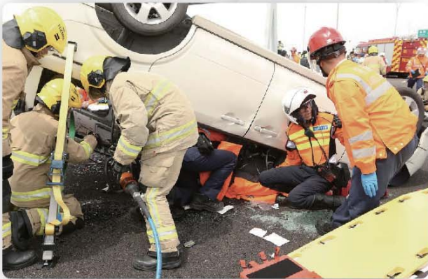
消防人員利用工具拯救被困於私家車內的乘客。

各部門在是次操練中緊密合作，就事故現場的協調合作、通訊及資訊發佈，以及改善各部門緊急預案安排方面，均達到操練的目標。