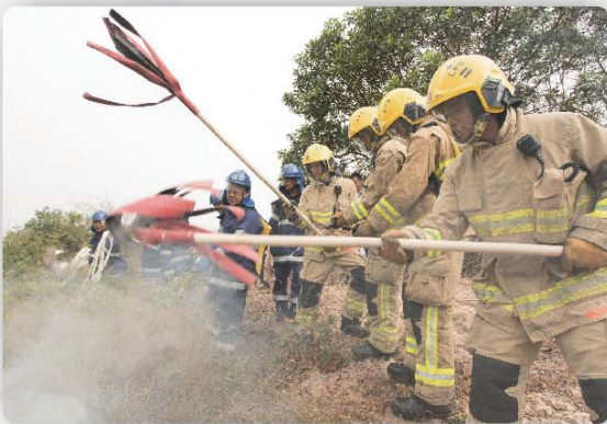
消防人員利用山草拍模擬撲滅山火。

新界西區過去曾發生多宗大型山火，包括今年3月21日屯門康寶路對上山坡的山火，面積達140公頃。該區亦有不少郊遊和遠足路線，不時有遠足或行山人士迷路或受傷，需要消防人員協助和拯救。通過這次演習，該區人員加強了處理大型山火及拯救行動的效率，以應付日後發生同類事故。