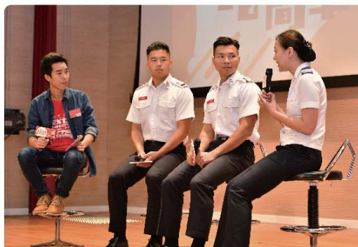
消防、救護和調派及通訊組人員在訓練營分享其工作經驗。