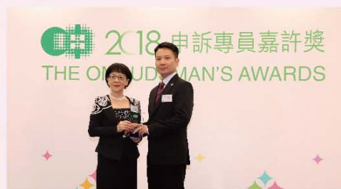
消防區長(樓宇改善課)3部榮華頒申訴專員嘉許獎—公職人員獎。