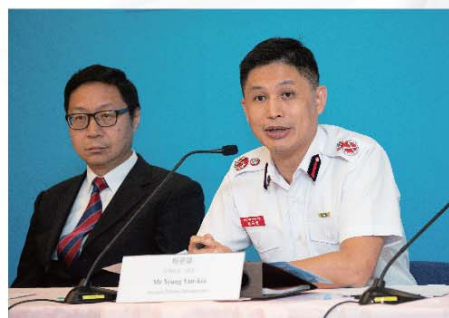
消防總長(總部)楊恩健向傳媒介紹調派後指引服務。