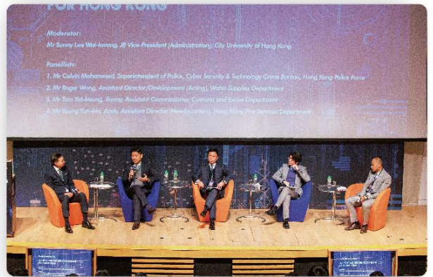
消防總長(總部)楊恩健(左二)在專題研討會上分享消防處應用資訊科技的經驗。

峰會在香港科學園的高銀會議中心舉行，由數十位業界人士、學者及政府人員擔任講者，分享他們在資訊科技及人工智能應用上的專業意見和寶貴經驗。專題研討會由香港城市大學副校長(行政)李惠光主持，其餘嘉賓分別為海關助理關長(稅務及策略支援)譚溢強、水務署署理助理署長/發展黃恩諾及警司(網絡安全及科技罪案調查科)莫俊傑。