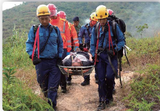
消防及救護人員模擬將傷者移至安全地方。