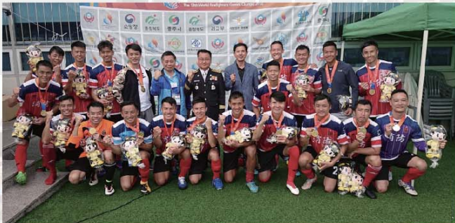
足球隊首次包辦十一人和五人賽事雙冠軍。