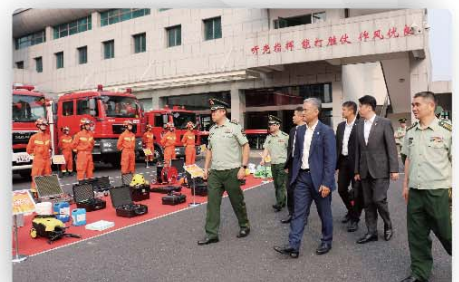
➤ 代表團參觀浙江省消防總隊的滅火及救援裝備。