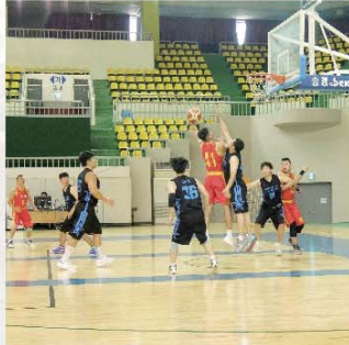
籃球隊勇奪五人籃球賽、三人籃球賽先進組及公開組的冠軍。