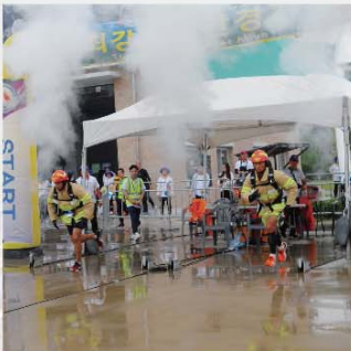
本處代表隊在被譽為賽事最高榮譽項目的「消防鐵人賽」中奪得3金2銅的佳績。