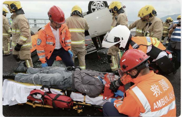
救護人員在事故現場為傷者進行初步治理。