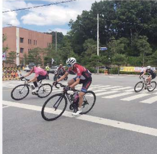
單車會代表全力衝刺，共奪得12面獎牌。