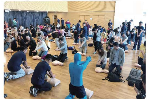
➤ 社區心肺復甦法及除顫器教育講座反應熱烈，有市民更向本處致送畫作以示謝意。