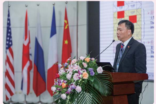
➤ 消防總長(九龍)羅紹衡博士在研討會上發表專題演講。

代表團又應北京消防總隊邀請，參觀總隊的指揮中心及訓練基地，並就日常訓練、行動調派、事故處理等方面進行深入討論和分享，豐富了彼此專業救援技術知識，建立了深厚的友誼。